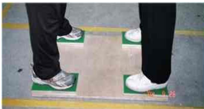
平步推手比賽場地